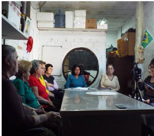
As mulheres, o trabalho e o artesanato