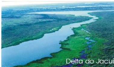
Delta do Jacuí