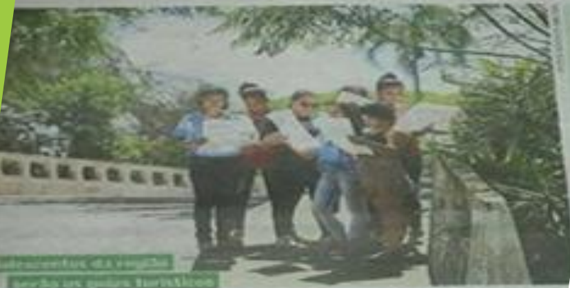
Atividade da rua serviço em grupo, trabalho

importante será mostrar que as ruas têm uma história a ser contada, como a do Arco Flor de Petrópolis, por onde passa a travessia Oscar Pereira de Faria, a porta de entrada da ilha. Segundo os pesquisadores, a rua teve importância durante a Revolução Farroupilha. Por ela, foram passados de