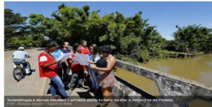
Turismólogos e alunos estudam o primeiro ponto turístico da ilha: o Antigo Flor da Pintada.