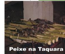
Peixe na Taquara