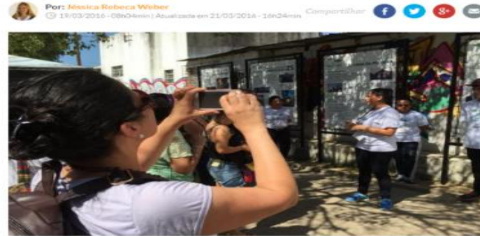
Ponto de partida do percurso é a praça da Ilha.

Painéis estão espalhados pelo bairro, e estudantes viraram guias locais