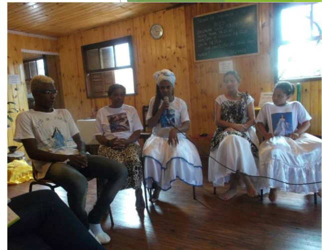
Presença Negra na Ilha da Pintada